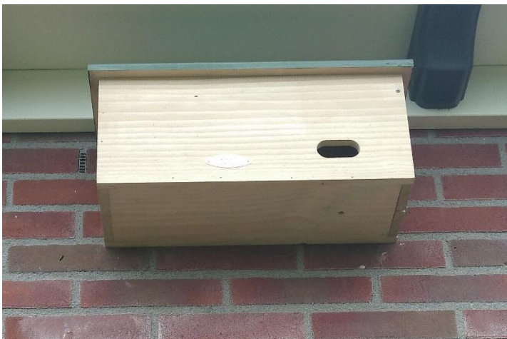
Nestkast voor een toerswel

In de middag hang ik een nestkast op voor een 'toerswel' (een gierzwaluw) aan de oostkant van onze pastorie op 4 meter hoogte. De andere nestkasten heb ik eerder al schoongemaakt en opgehangen. Het is wachten op de lente. In de middag zit ik van 14.00 - 16.00 uur in de kerk. Wat een weldadige stilte. Er branden een paar kaarsjes, maar in de middag komt er verder niemand. Ik doe mijn zangoefeningen in de kerk. Ha, hier klinkt het een stuk beter dan thuis. Daarna begin ik met de voorbereiding van een nieuw artikel. Heerlijk, daar ben ik lang niet aan toegekomen. Later meer hierover.