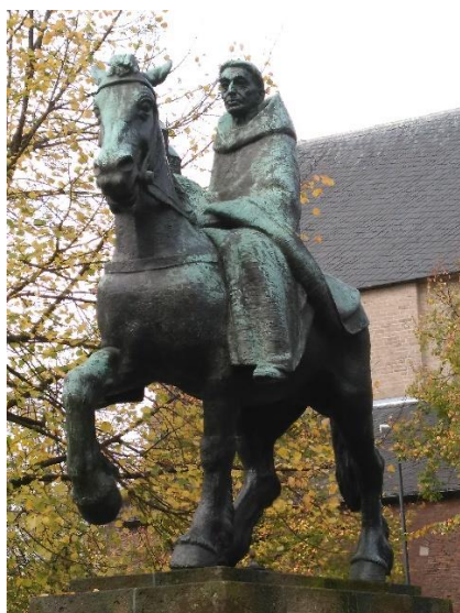
(Willibrord, op het Janskerkhof te Utrecht)