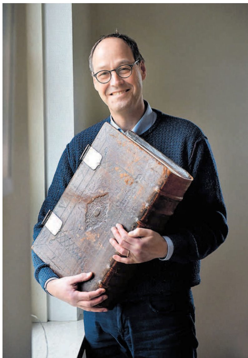
Waarschijnlijk heeft een Franse soldaat met zijn zwaard in de kanselbijbel geslagen. Bij de restauratie is de beschadiging zichtbaar gehouden.