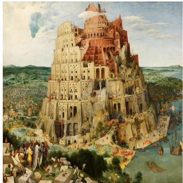
Pieter Brueghel de Oude, de toren van Babel

God ziet de onderdrukking, God ziet de trots, God ziet de angst van de machtige mensen om hun macht kwijt te raken. En dan bedenkt God een grappig plan: het verwarren van de taal. Dat is een straf voor de machtigen, voor de Nebukadnezars van deze wereld. Maar tegelijk is het een bevrijding, een zegen voor het onderdrukte volk. Er ontstaat een veelheid aan taal en diversiteit van cultuur. In ferskaat oan folken! Gods oplossing voor Babylonische torens is diversiteit en veelheid. Dat is gijn straf, mar in seine!