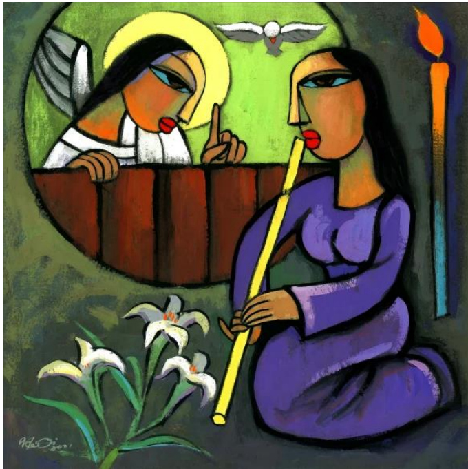
He Qi, The annunciation

Ik voel dat mijn taal bijna ontoereikend is om dit te verwoorden. Maar dit weet ik wel: om ontvankelijk te zijn voor God is de stilte onontkoombaar. Dan heb ik het niet over de stilte van de eenzaamheid, maar over stilte zoals in de Nijkleaster-drieslag 'stilte, bezinning en verbinding'. Op één of andere wijze moeten we ons voorbereiden, klaarmaken en innerlijk ruimte maken om te kunnen ontvangen. Dat kan door te bidden, te mediteren, te wandelen, te praten, te zingen. Er is niet één vaste methode die goed is voor iedereen. Maar we moeten wel een eigen weg vinden van ruimte maken, van voorbereiding. Daarom zie ik Zacharias' tijd van stilte niet als een straf maar als een mooie tijd van retraite, van verstilling, van voorbereiding. Hij had die tijd nodig om te ontdekken dat bij God niets onmogelijk is.